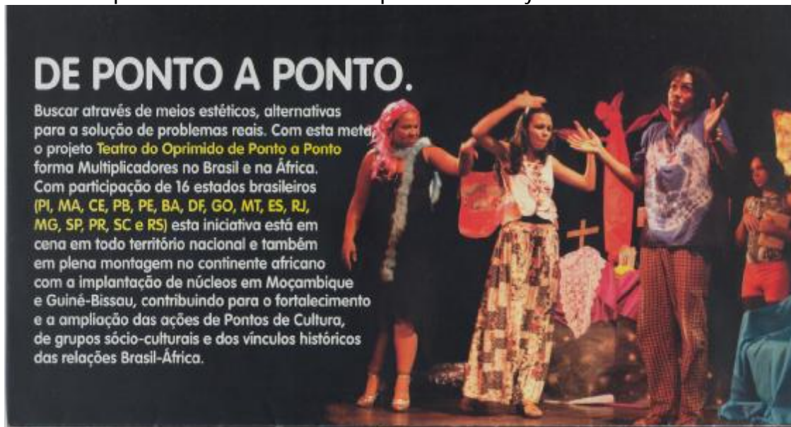
Taller de Teatro del Oprimido